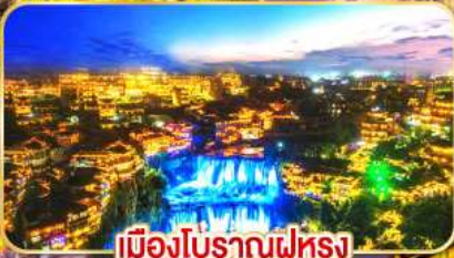
เมืองโบราณฝูหรง