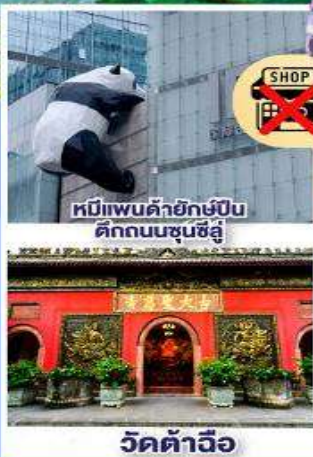
หมีแพนด้ายักษ์ปั้น ดีกถนนซุนซีอู๋