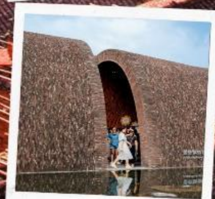
จิ่งเต๋อเจิ้น