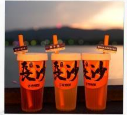
เซียงเจียงริเวอร์ไซด์