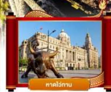
หาดไว่กาน