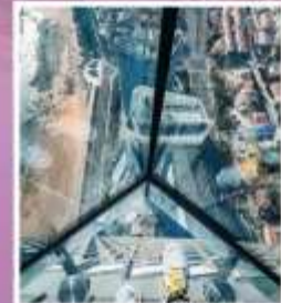
QINGDAO HAITIAN CENTER