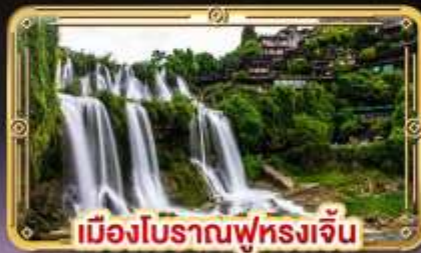
เมืองโบราณฟู่หลงเจิ้น