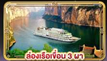
ล่องเรือเขื่อน 3 ภา