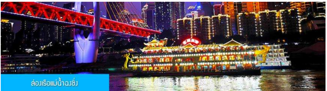
ล่องเรือแม่น้ำฉงชิ่ง