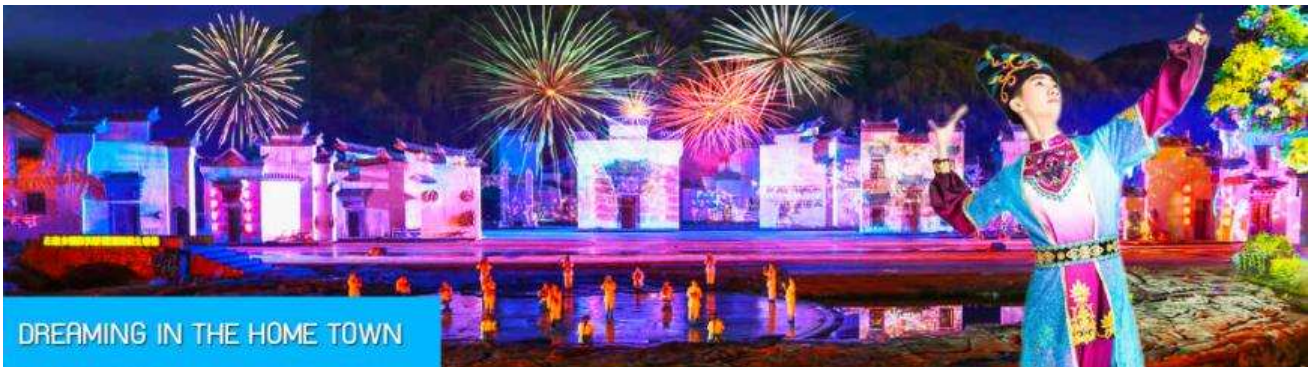
DREAMING IN THE HOME TOWN

หลังอาหารนำท่านเดินทางเข้าที่พัก หรือท่านสามารถเลือกซื้อโปรแกรมเสริม เป็นบัตรชมการแสดง ชุด DREAMING IN THE HOME TOWN เป็นการแสดงบนเวทีขนาดใหญ่ที่จัดสร้างขึ้นกลางแจ้ง ท่ามกลางธรรมชาติที่มีภูเขาเป็นฉากหลัง ใช้ทุนสร้างกว่า 280 ล้านบาท เป็นการแสดงที่น่าดูชมที่สุดในมณฑลเจียงซี แต่ละฉากการแสดงมีการออกแบบเวที ฉากประกอบที่พิถีพิถัน ประณีต และอลังการ ใช้ทีมงานนักแสดงหลายร้อยคน และระบบแสง สี เสียงที่ทันสมัยประกอบในการแสดง