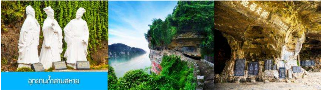
อุทยานก้าสามสหาย