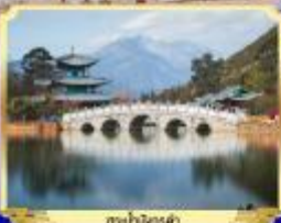
อู๋เซี่ยหยาน อู๋เซี่ยหยาน