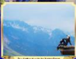
อู๋เซี่ยหยาน อู๋เซี่ยหยาน