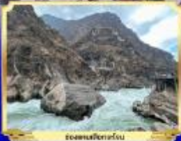
อู๋เซี่ยหยาน อู๋เซี่ยหยาน