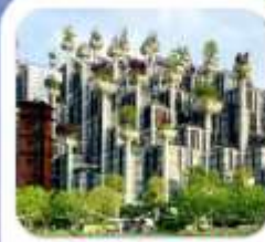
"อาคารพันต้นไม้"