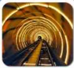
"ลอดอุโมงค์เลเซอร์"

เซี่ยงไฮ้ • ล่องเรือเมืองโบราณดูเจียเจี้ยว • นั่งรถไฟลอดอุโมงค์เลเซอร์ POP MART • วัดจิ่งอัน • อาคารพันต้นไม้ • ตลาดรอยปีเงินหวงเมี้ยว อิสระช้อปปิ้งเต็มวัน หรือ จะซื้อตั๋วเที่ยวดีสนีย์แลนด์