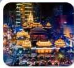
"วัดจิ่งอัน"