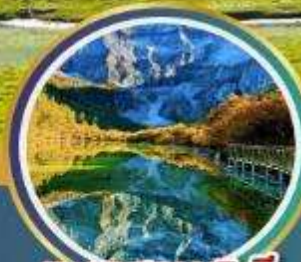
ทะเลสาบ 5 สี