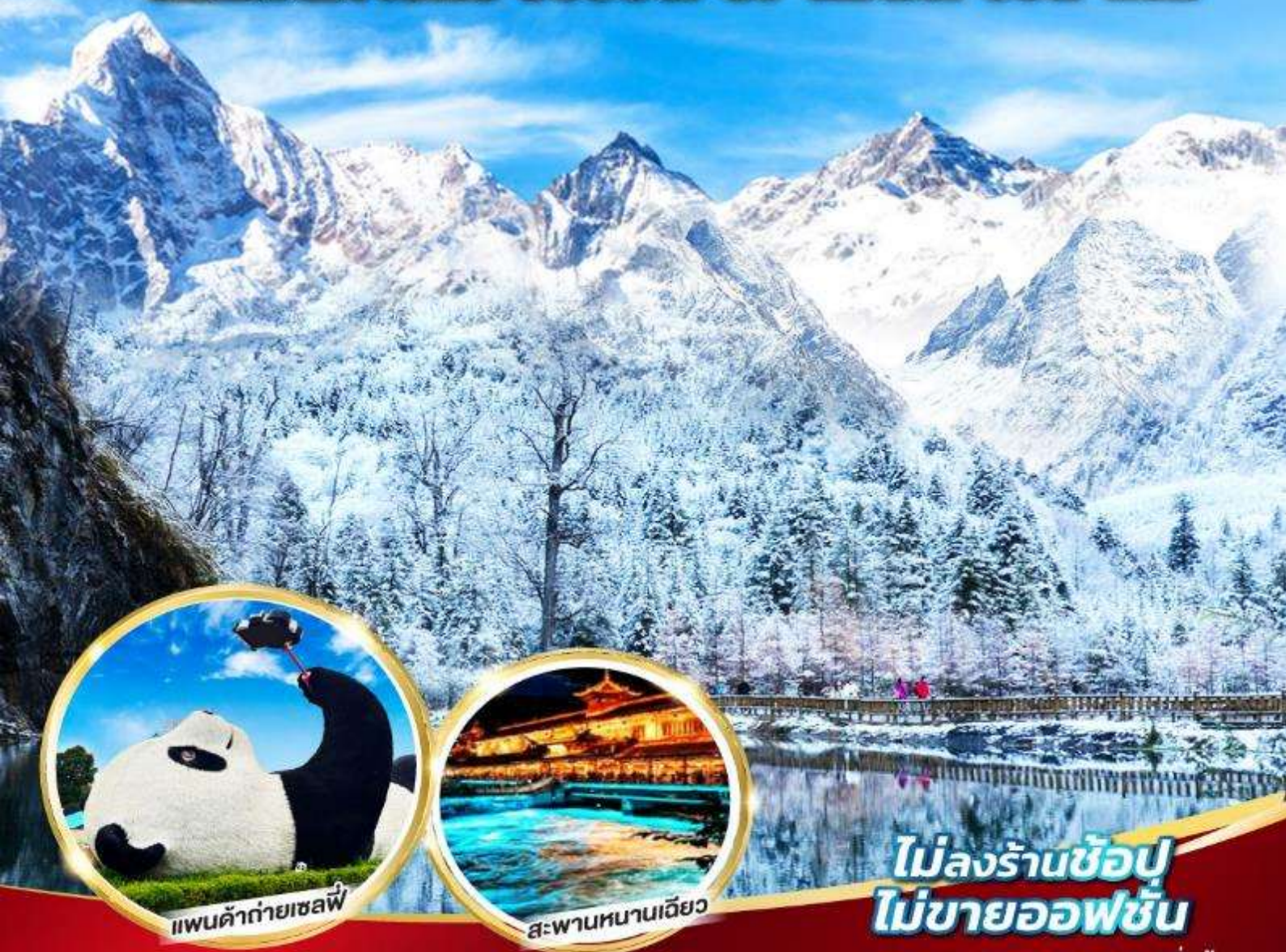
แพนด้ายักษ์เซลฟี่

หมี่แพนด้ายักษ์ ช้อปปิ้ง POP MART 5 วัน 4 คืน