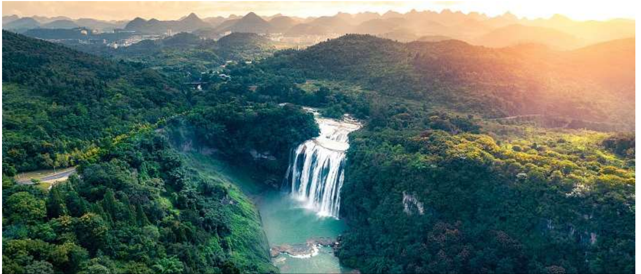
A panoramic view of the Huangguoshu Waterfall scenic area, Anshun, Guizhou Province.

นำท่านเข้าชม โซว์กลางคืนหวงกั๋วซูประกอบแสงสีเสียง (รวมลิฟท์ขึ้น-ลง) เพื่อยกระดับประสบการณ์ของนักท่องเที่ยว หน่วยงานท้องถิ่นได้สร้างพื้นที่แห่งใหม่ชมทิวทัศน์ โครงการทัวร์กลางคืนแสงและเงาที่หวงกั๋วซู อิงจากจุดชมวิวยุคโบราณชาติ ได้รับการเปิดตัวอย่างเป็นทางการในปี 2021 ด้วยการไฮเทคโนโลยีแสงสีเสียงและแสงเงา ผู้มาเยือนได้สัมผัสประสบการณ์การเดินทางที่มีสีสัน ชื่นชมความงามอันบริสุทธิ์ ที่มีความกลมกลืนระหว่างธรรมชาติและมนุษย์ มีเสน่ห์ของประวัติศาสตร์และวัฒนธรรมท้องถิ่น ชมการแสดงเต้นรำและร้องเพลงของชนชาติส่วนน้อยเจ้าของพื้นที่ กล่าวได้ว่า "ทัวร์กลางคืนหวงกั๋วซู" สามารถดึงดูดนักท่องเที่ยวได้ประมาณ 180,000 คนในปี 2023