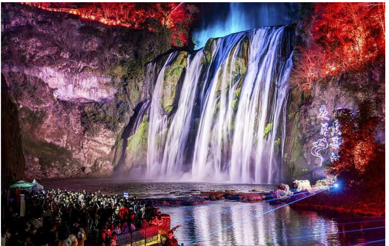
A colorful night view is captured at the Huangguoshu Waterfall scenic area, Anshun, Guizhou Province. https://news.cgtn.com/news/2024-05-30/-Night-Tour-at-Huangguoshu-show-takes-visitors-on-a-colorful-trip