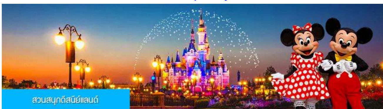
สวนสนุกดิสนีย์แลนด์

พักที่ โรงแรม Luna Garden Hotel or Holiday Inn Express Hotel 4* หรือเทียบเท่าในเมืองเซี่ยงไฮ้