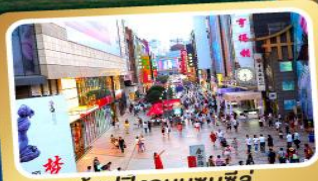
ช้อปปิ้งถนนชุนซีลู่