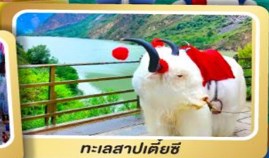
ทะเลสาปเตี้ยซี