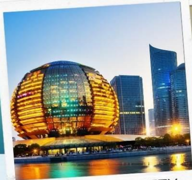
HANGZHOU CITY BALCONY