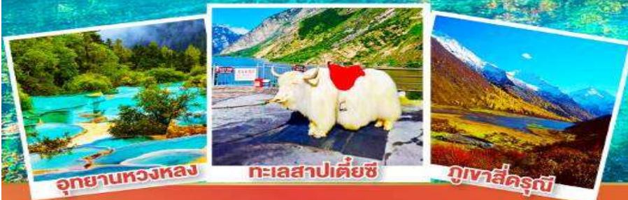
อุทยานทวงหลง