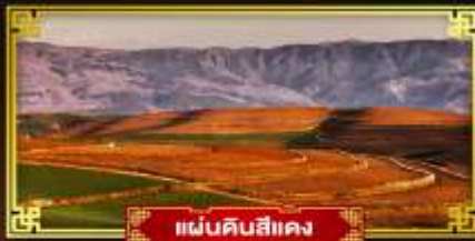
แผ่นดินสีแดง