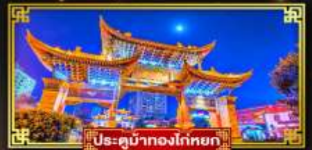
ประตูน้ำทองโก่หยก