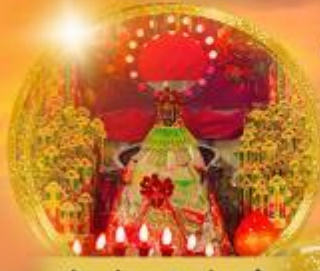
เจ้าแม่กวนอิมส่องซ่า