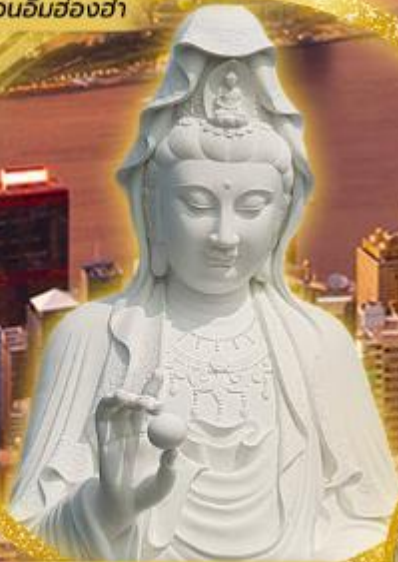
วัดชีซาน