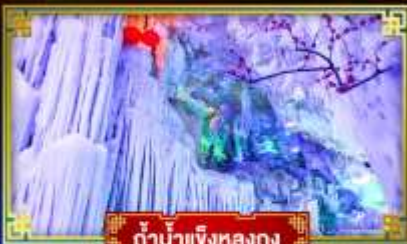
ตำนานเงี้ยวหลงกวง

"เที่ยว 2 มณฑล กวางซี-กั๋วโจว" สุดอลังการ น้ำตก 2 พรมแดน แหล่งท่องเที่ยวระดับ 5A