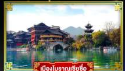
เมืองโบราณเซี่ยซือ