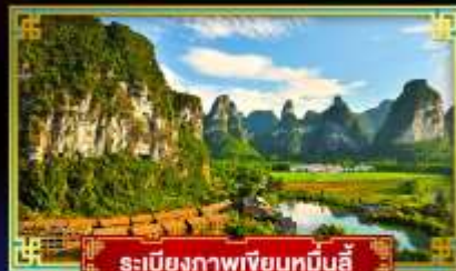
ระเบียบภาพเขียนหมินอี