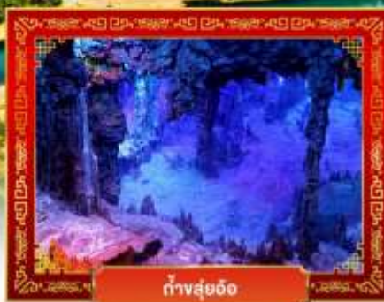
ถ้ำสุ่ยอ้อ