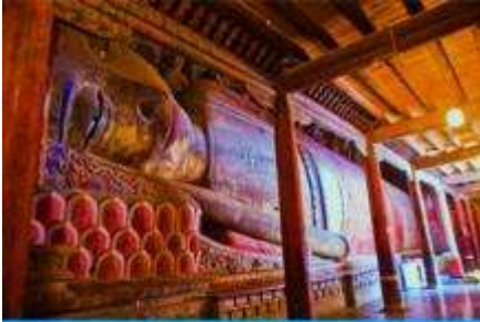
วัดพระใหญ่

พักที่ SI LU QIAN XI HOTEL โรงแรมระดับ 4 ดาวท้องถิ่น หรือเทียบเท่าในเมืองจางเยี่ย