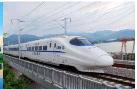
ตู้รถไฟความเร็วสูง