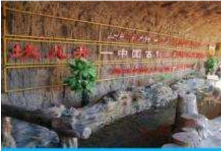
ระบบชลประทานคู่หลูฟาน