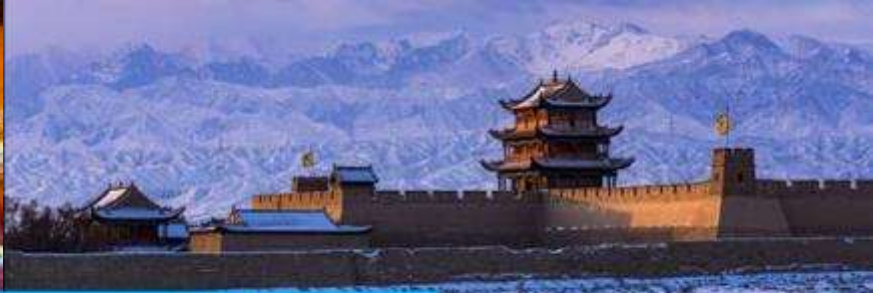
ด่านเจียวกวน

วันที่สาม เมืองจางเยี่ย – วัดพระใหญ่เมืองจางเยี่ย –เดินทางสู่เมืองเจียวกวน-ด่านเจียวกวน