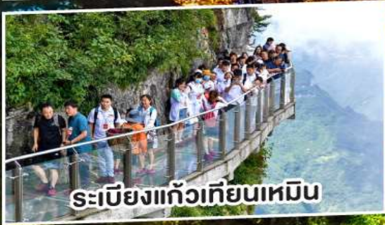
ระเบียงแก้วเทียนเหมิน