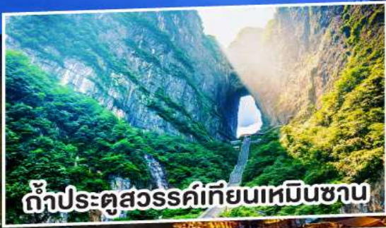
ถ้ำประตูสวรรค์เทียนเหมินชาน

สัมผัสมนต์ขลังฟูหรงเจิน พิษิตระเบียงแก้วเทียนเหมิน