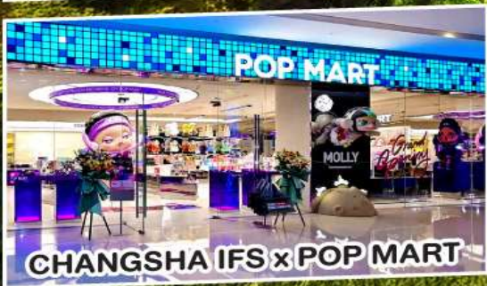
CHANGSHA IFS x POP MART