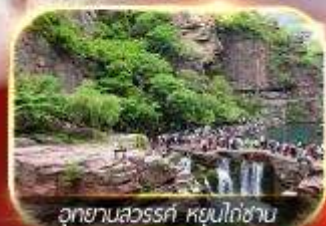
อุทยานลวรัท หุยนโกซาน