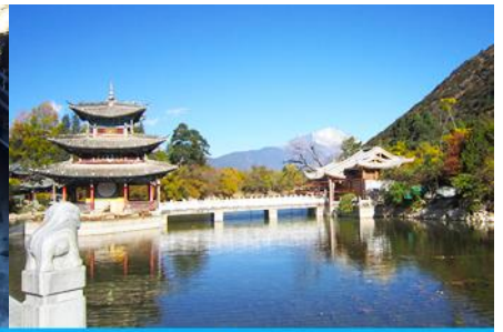
สระน้ำมังกรดำ