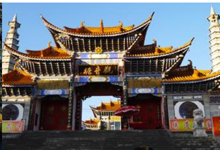
วัดเจ้าแม่กวนอิมเปลงกาย