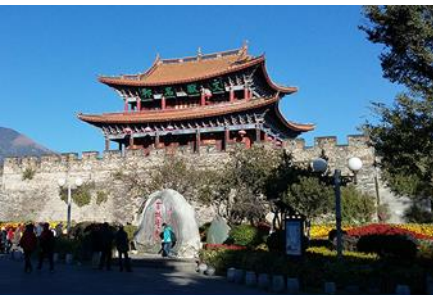
เมืองโบราณต้าลี่

18.26 น. เดินทางถึงเมืองต้าลี่ นำท่านสู่ภัตตาคารในเมืองต้าลี่ ค่ำ รับประทานอาหารค่ำ ณ ภัตตาคาร หลังอาหารนำท่านเข้าสู่ที่พัก พักที่ DALI ZHUANG HOTEL ระดับ 4 ดาวหรือเทียบเท่าในเมืองต้าลี่