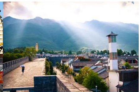
หมู่บ้านซีโจว(หมู่บ้านชาป๋อ)