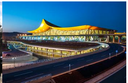
สนามบินเบียวคุนหมิง