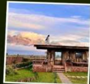
YUN DI AN CAFE