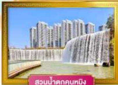
สวนน้ำตกคุนหมิง