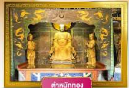
ตำหนักทอง