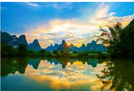
ระบียงภาพร้อยลี้

พักที่ MINGSHI YISHU HOTEL ระดับ 3 ดาวท้องถิ่นหรือเทียบเท่าในอุทยานหมิงชื้อ