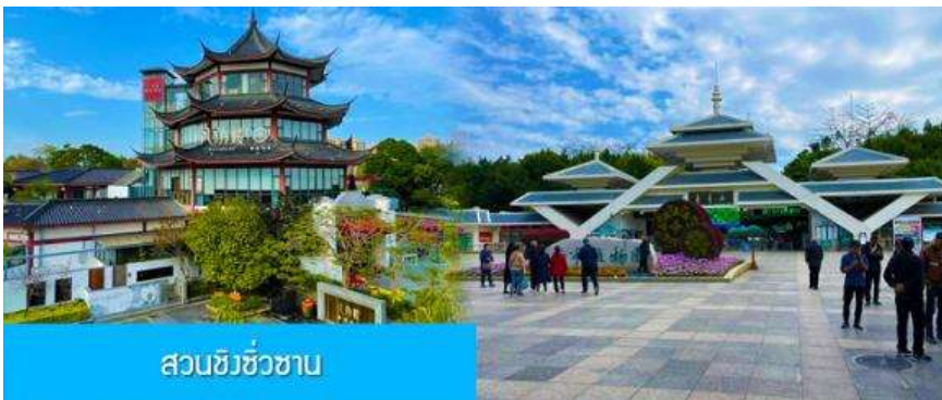
สวนชิวชิวซาบ

อิสระอาหารมื้อเย็น เพื่อความสะดวกในการเดินช้อปปิ้ง ลิ้มรสอาหารท้องถิ่นหลากหลายรสชาติได้ตามอัธยาศัยพักที่ UNIVERSAL HOTEL ระดับ 4 ดาวท้องถิ่นหรือเทียบเท่าในเมืองหนานหนิง