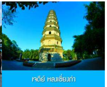
เจดีย์ หลวงเซียงก่า