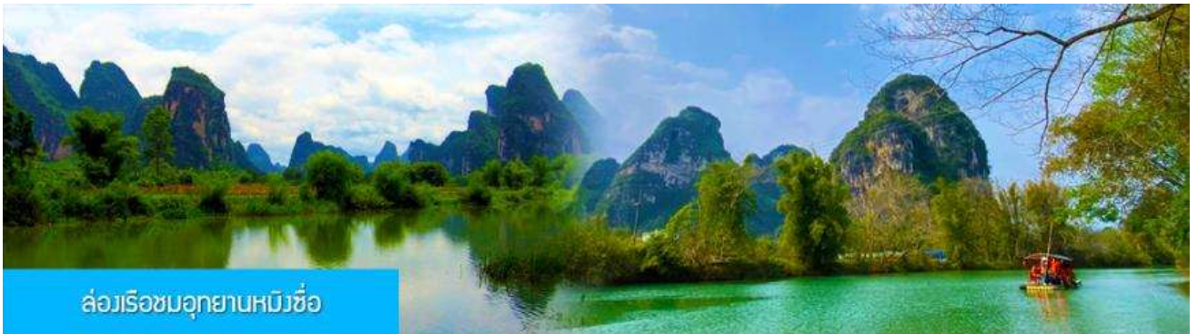
ล่องเรือชมอุทยานหมิงชื้อ