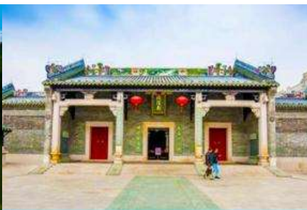
วัดเจิวหวงเมี้ยว