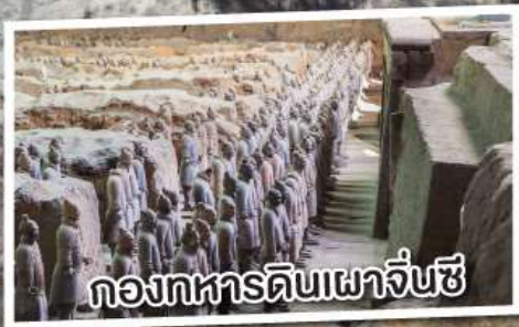
ก่องทหารดินเผาจิ๋นซี