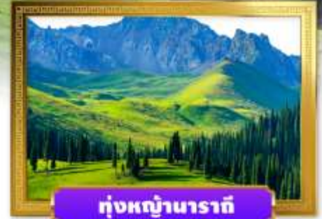
หุบหญ้านาราตี