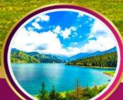
ทะเลสาบเทียนชาน