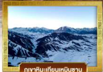
ภูเขาหิมะเทียนเหินซาน

เดินทางโดยสายการบินโซน่าชาท์เทิร์นแอร์ไลน์