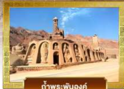
ก้ำพระปันองค์