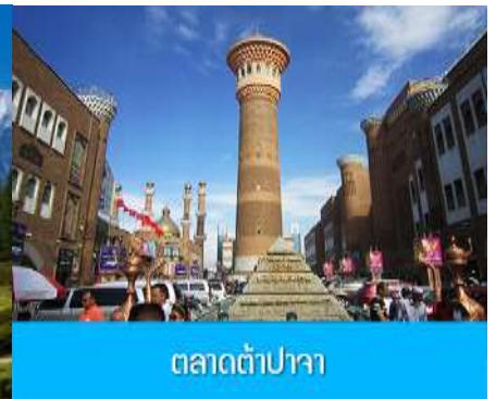
ตลาดต้าปาจา

วันที่เจ็ด เมืองอูรูมฉี – ภูเขาเทียนชาน -ตลาดต้าปาจา