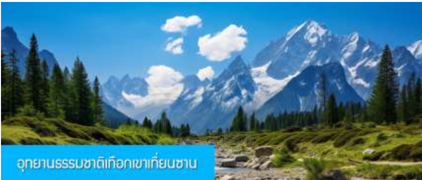
อุทยานธรรมชาติเทือกเขาเทียนชาน

พักที่ HAMPTON BY HILTON URUMQI HOTEL โรงแรมระดับ 4 ดาวหรือเทียบเท่าในเมืองอูรูมฉี