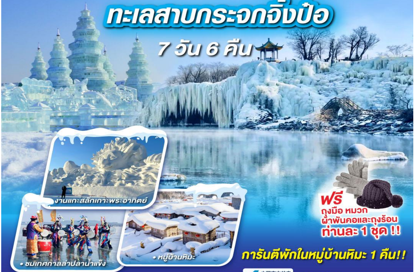
งานแกะสลักเกาะพระอาทิตย์