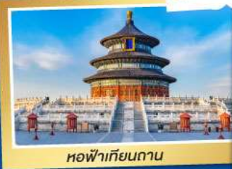
หอฟ้าเทียนถาน