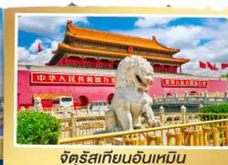
จัตุรัสเทียนอันเหมิน