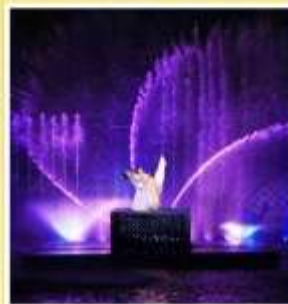
โชว์ MEET XISHI