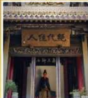
บ้านเกิด 4 ยอด หญิงงามไซซี