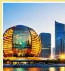
HANGZHOU CITY BALCONY