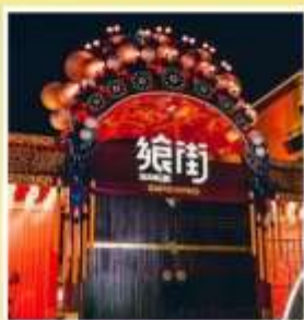
ถนนคนเดินกู่เยว่ GUYUE STREET