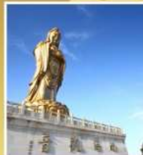
องค์เจ้าแม่กวนอิมหนานไห่