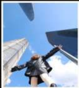
เช็กเมบู 3 ตึกใหญ่ แห่งเซี่ยงไฮ้