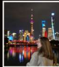
SHANGHAI (CLASSIC NIGHT)