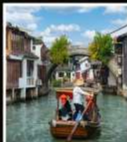
เมืองโบราณ จูเจียเจี้ยว