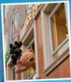
คาเฟ่ 13 DEMARZO