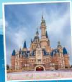
ดิสนีย์แลนด์