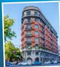
ถนนอู่คัง