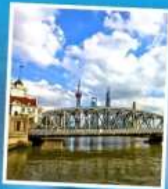
สะพานไว๋ปายตุ้เจียว