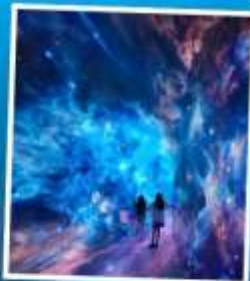
SPACE & TIME CUBE