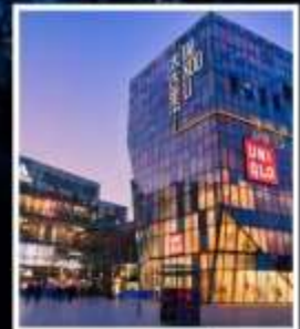
ย่านซานหลี่ถุน