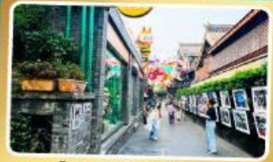
ถนนโบราณชอยกวางชอยแคบ