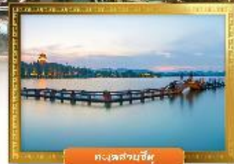
ทะเลสาบอู๋หู