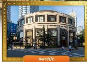
ตงจางมิกซ์

☑️ ซื้อบิง POP MART ถ่ายรูปคู่กันคิมอิกซ์