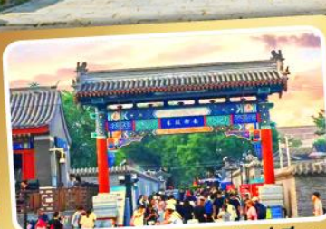
ถนนโบราณหนานหลิวกู่เซียง