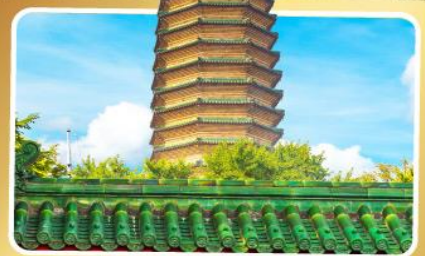
วัดพระเจี๋ยวแก๋ว

เมนูพิเศษ เปิดปักกิ่ง, ชาหมูหม้อไฟ อาหารกวางตุ้ง, อาหารเสฉวน