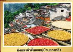
มังกรระชาจีนหมู่บ้านหวงหลิง