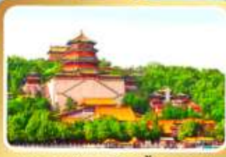
พระราชวังฤดูร้อนอี้เหอหยวน