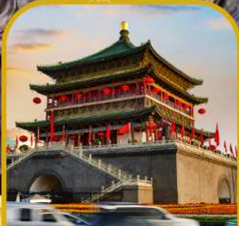
จัตุรัสหอกลอง หอระฆัง