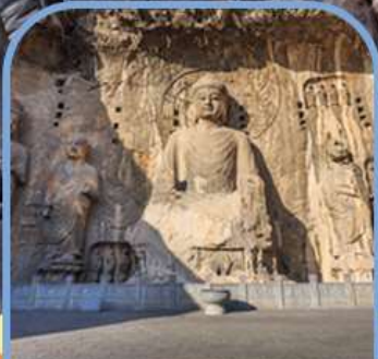
ถ้ำแกะสลักพาสินหลงเหมิน