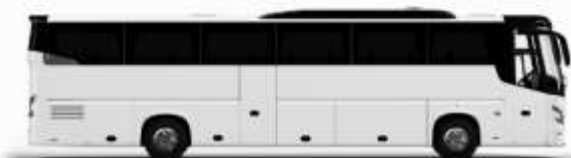
ตัวอย่างรถโดยสาร 1 คัน

ค่าที่พักตามที่ระบุในรายการหรือเทียบเท่าระดับเดียวกัน (พักห้องละ 2 ท่าน) หากประเภทห้องที่ท่านริเคลอมาเกิน อาทิ เช่น ริเคลอห้องพักเป็น TWIN BED หรือ DOUBLE BED ทางบริษัทขอสงวนสิทธิ์ในการปรับประเภทห้องพัก เป็นตามที่โรงแรมมีอยู่ โดยไม่ต้องแจ้งให้ทราบล่วงหน้า