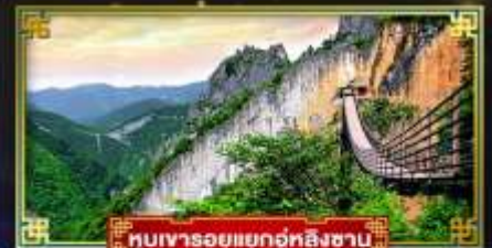
หุบเขารอยแยกอู่ทงซิงซาบ