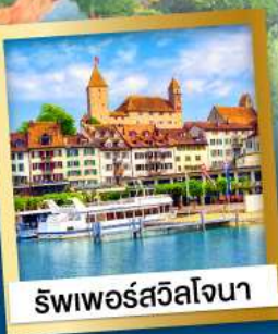
ริพเพอร์สวิลล์