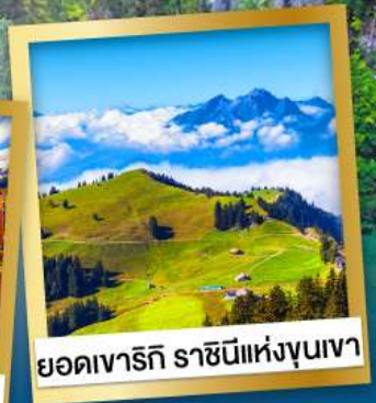
ยอดเขารัก ราชนิแห่งขุนเขา