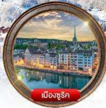
เมืองซูริก