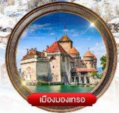
เมืองมงเทรซ