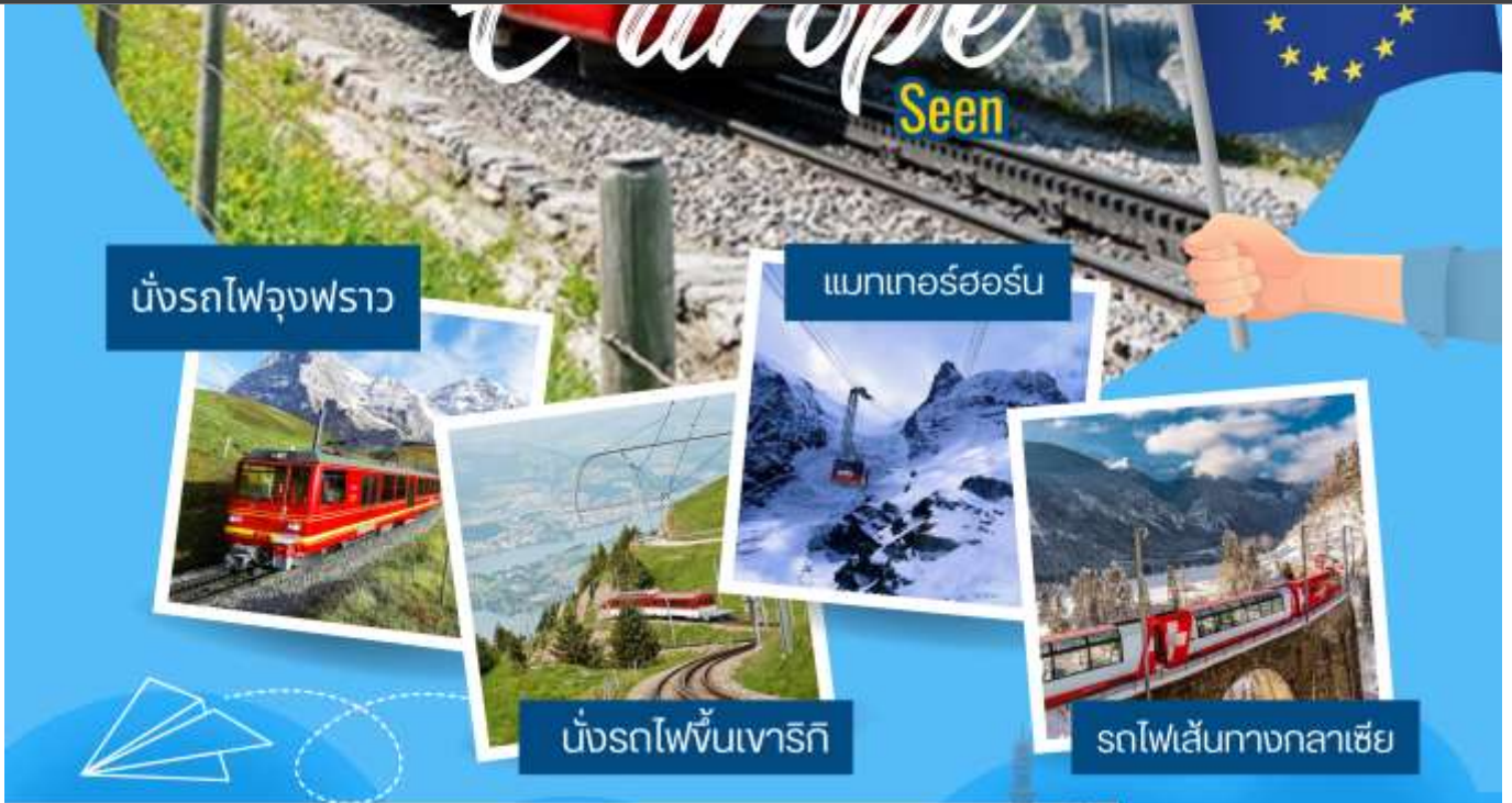
นั่งรถไฟจุงฟราว